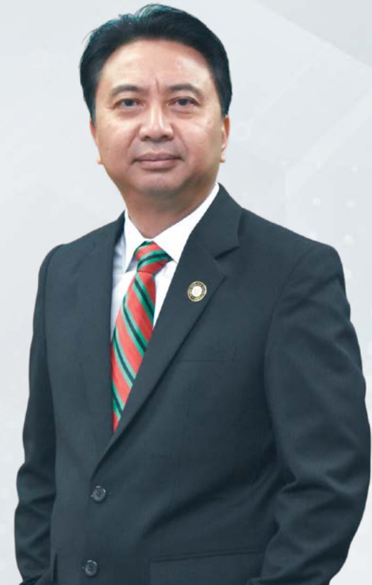
DATU HAJI HAMDEN BIN HAJI MOHAMMAD Pengarah Hutan Sarawak

Saya yakin dengan usahasama berterusan dan secara kolektif di antara semua pihak dalam jabatan, matlamat OACP JHS 2021-2025 akan dapat dicapai dan memberi manfaat secara menyeluruh dalam menginstitusikan Jabatan Hutan Sarawak ke arah tadbir urus baik, berintegriti dan bebas rasuah.